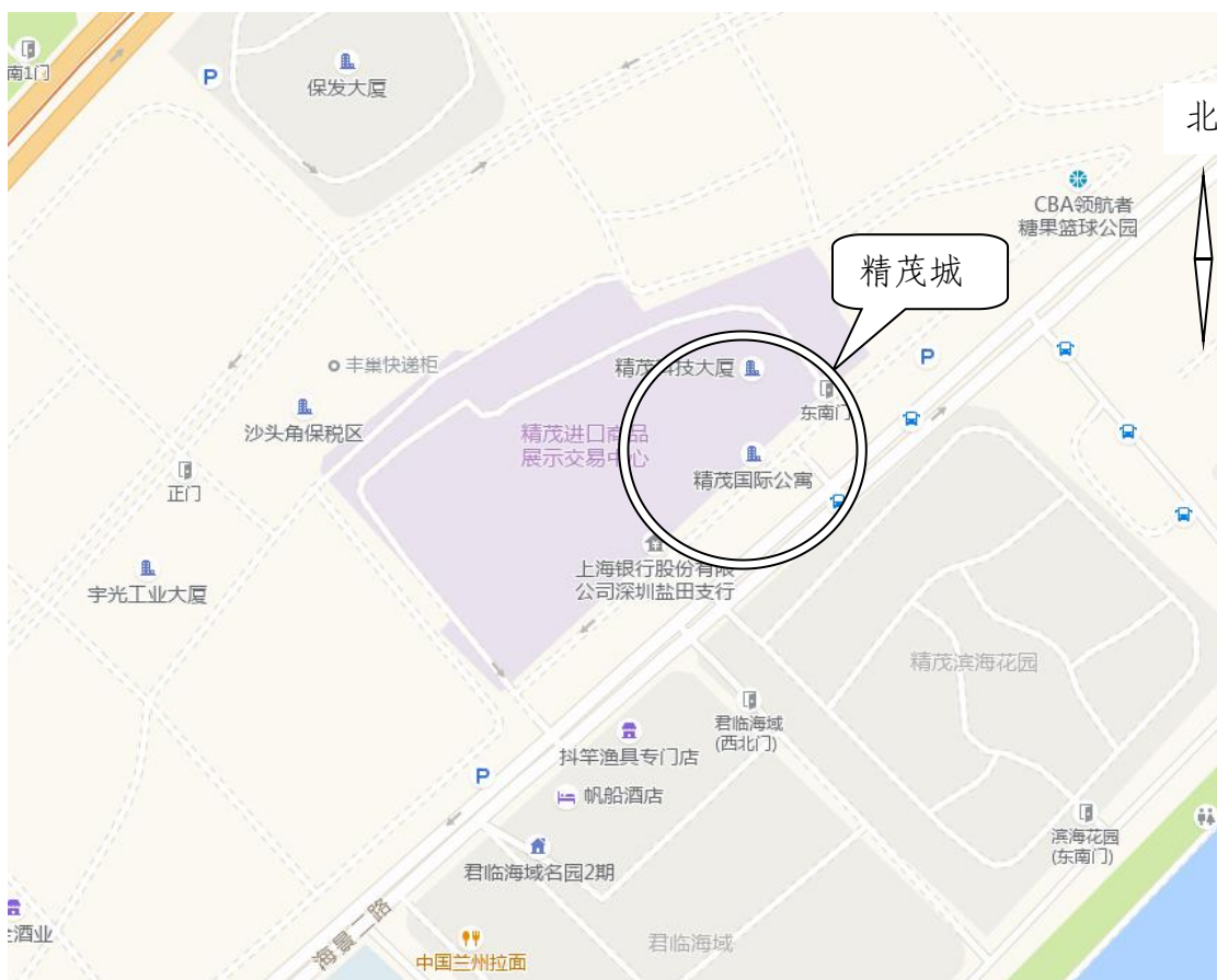
图 1 位置平面图

工程包工包料价为 95 元/平方米，计费隔墙面积约 82 平方米，含税合计金额 8179.50 元，截止事故发生，双方未签订施工合同或协议。工程于 2021 年 11 月 20 日开始施工，事发时施工人员正在 524 商铺内安装与 525 商铺隔墙上的石膏板。