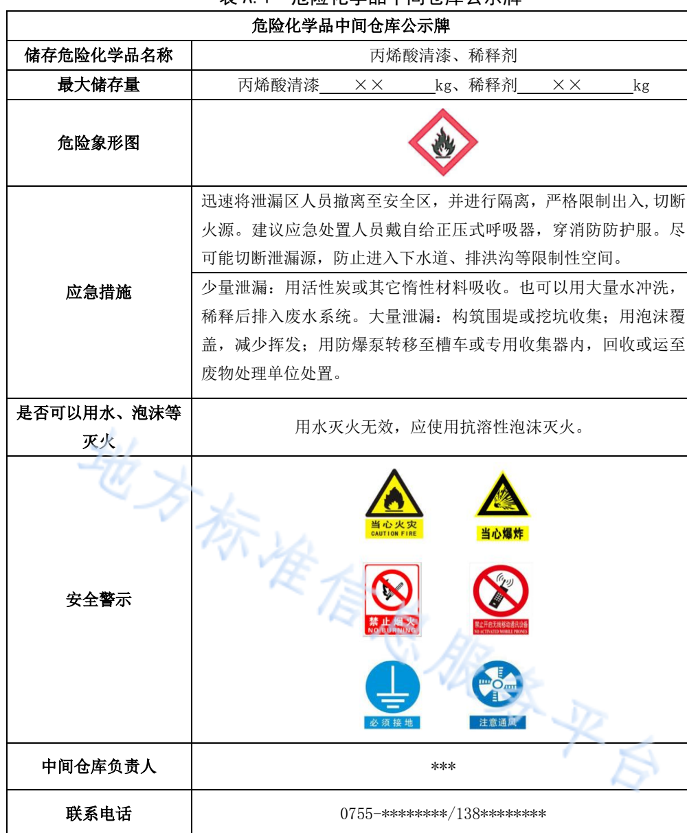
表 A.1 危险化学品中间仓库公示牌